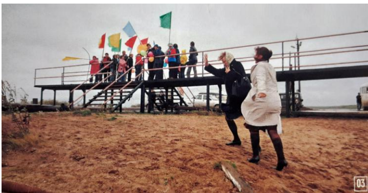
03. Учителей ждали с флагами, невзирая на пронизывающий ветер