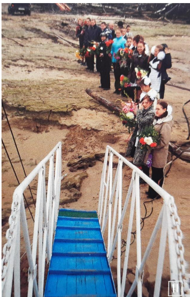
11. В Ханты-Мансийский округ приехали не только лучшие, но и самоотверженные