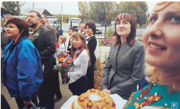
01. Первая остановка в посёлке Елизарово