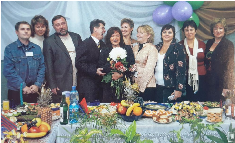
10. Что ещё можно подарить учителю, кроме цветов.