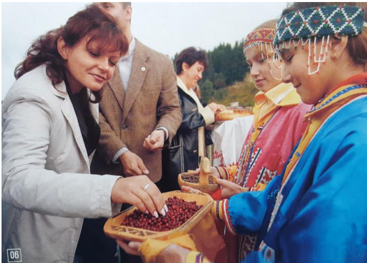
06. В национальном посёлке Шеркалы гостей угощали брусникой и кедровыми орехами.