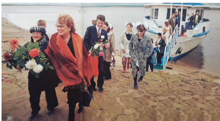
02. Лучшие учителя приехали в Ханты-Мансийский округ по приглашению правительства ХМАО