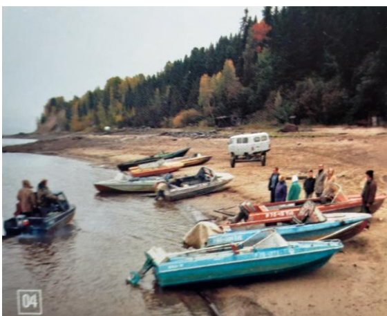
04. Учителя из соседних деревень приплывали на моторках на открытые уроки «знаменитых» коллег