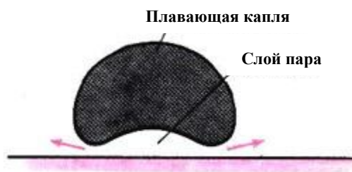
Рис. 3 Поперечное сечение капли Лейденфроста

При температуре пластины ниже точки Лейденфроста вода растекается по пластине и быстро отводит тепло от нее, что обеспечивает полное испарение капли за несколько секунд. Когда температура равна или выше точки Лейденфроста, нижняя часть капли, нанесенной на пластинку, почти мгновенно испаряется, и давление образовавшегося пара не позволяет остальной части капли коснуться пластины. Слой пара постоянно пополняется за счет дополнительной воды, испаряющейся с нижней поверхности, благодаря теплу от пластины, которое излучается и проводится сквозь пар. Хотя толщина слоя менее 0,1мм у наружной границы и около 0,2 мм в центре, он резко замедляет испарение капли (рис. 3). Таким образом пар поддерживает и защищает каплю в течение минуты или около того.