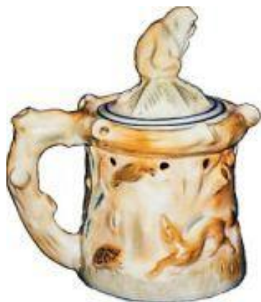
Кружку с секретом украшают герои басен Крылова. Работа советских мастеров второй половины XX века.

Третья кружка похожа скорее на скульптурную композицию, чем на предмет домашней утвари. Её сюжет посвящен героям басен И. А. Крылова: вороне, лисице, мартышке и медведю. Контрастом выглядит небрежная надпись на фасадной стороне кружки, которая на фотографии не видна. По мокрой глине до обжига выцарапано: «Поздравляю с днём рождения 50 лет. Напейся но...» Похоже, что кружка изготовлена в опытном цехе какого-то фарфорового завода по желанию автора надписи. Высокое качество дает основание предположить, что кружка была готова к серийному выпуску, и мы можем только сожалеть, если что-то этому помешало.