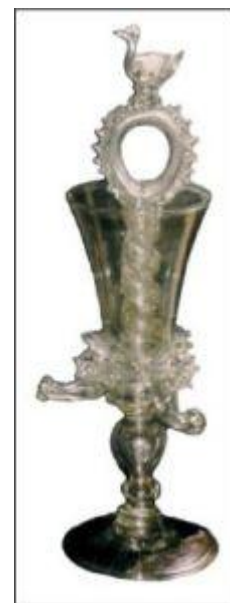
Потешный кубок был изготовлен на Измайловском заводе в конце XVII – начале XVIII века. Кубок хранится в Государственном музее керамики в Кускове.

Посмотрите ещё раз на фотографию. Кажется, что наливаемое в кубок вино должно тут же вытечь из нижних сосочков. Необходимо поскорее заткнуть их пальцами? Напрасный страх. Пускай слуга наливает вино, ни капли не прольётся снизу.