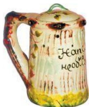
Кружка «Напейся, но не облейся». Изготовлена в СССР. Хранится в частной коллекции в Москве.

Первый из неизвестных сосудов, скорее всего, изготовлен ранее, чем конаковская кружка. Знакомясь с иностранными коллекциями сосудов с секретами, я первым делом интересовался, есть ли в них русские сосуды. Многие экспонаты не имели марок, а хозяева обычно не знали их происхождения. Но один раз счастье мне улыбнулось. В Англии, в родовом поместье Кейн Энд крупнейшего коллекционера головоломок Эдварда Хордерна, я увидел большую кружку, на боковой стороне которой были знакомые русские слова: «Напейся, не облейся». Никаких других знаков, помогающих установить происхождение кружки, не было. Гостей в доме в тот день было очень много, а хозяин коллекции болел, и я не решился допытывать его вопросами о том, как в его коллекцию попала русская кружка с секретом.