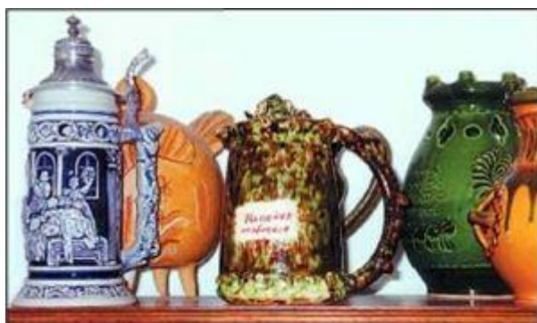
Русская кружка «Напейся, не облейся» (в центре) среди других сосудов с секретами из коллекции английского собирателя Л.Э. Хордерна.

Однако главный секрет – в маленькой дырочке, спрятанной под ручкой. Только зажав её пальцем, можно напиться, не облившись.