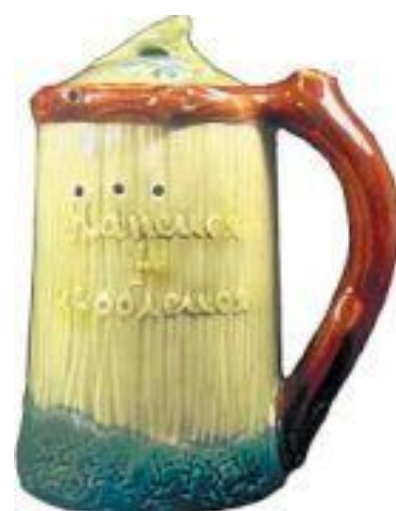
Кружка «Напейся, но не облейся» – изделие Конаковского фаянсового завода середины XX века.

Секрет кружки спрятан в ручке – она сделана полый. Канал, проходящий внутри ручки, имеет вход у дна кружки и выход в одном из пяти сосочков, идущих по верхнему ободу. Таким образом, из кружки нужно пить, всасывая в себя содержимое через сосочек.